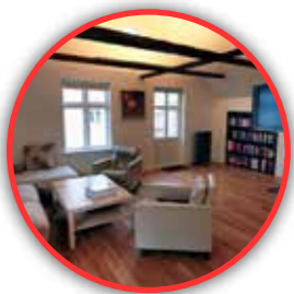
REYKJAVIK APARTMENTS Reykjavik, Islandia