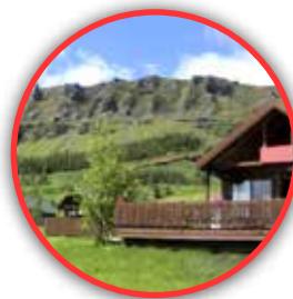
KIRKJUBÆJARKLAUSTUR COTTAGE Kirkjubæjarklaustur, Islandia