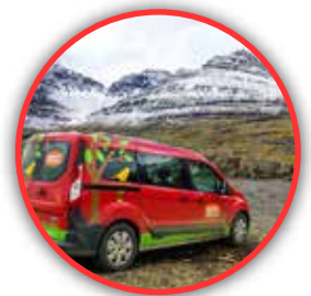
TRANSPORTE EN ISLANDIA, Coches de 4 a 9 plazas según el número de viajeros