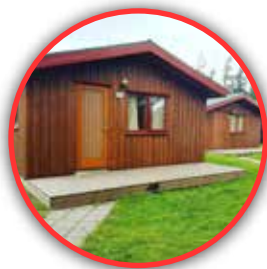
COTTAGE Hella, Islandia